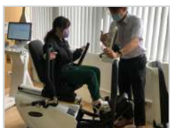
樂齡生活健康體適能處方設計 (選修) 規劃適合高齡者的健康運動處方