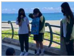
休閒活動規劃與設計 (必修) 帶領國小生認識海洋廢棄物 培養服務與活動引導能力