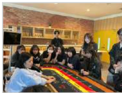
博弈事業經營與管理 (必修) 讓學生實際學習多種博弈遊 戲操作，深入了解產業經營 模式與服務流程