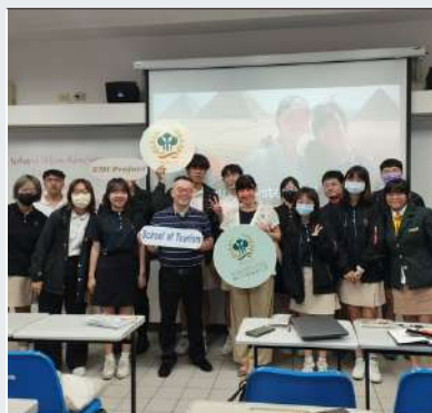
加拿大姊妹校Humber College 的 教授觀摩EMI課程