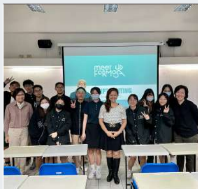
聘請 Free Walking Tour 業師教授 雙語導覽解說技巧