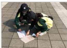
休閒活動規劃與設計 (必修) 體驗旗山老街實境解謎遊戲 激發創意提升活動規劃與執行力