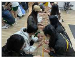
活動引導學 (必修) 結合齊眉棍等團隊合作活動， 培養學生的領導力與團隊協作 能力