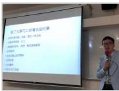
休閒遊憩概論 (必修) 畢業學長分享生涯規劃， 幫助學生了解產業趨勢和 啟發未來發展方向