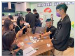
遊憩心理學(選修) 透過玩桌遊認識遊戲機制， 並設計主題性桌遊，提升創 意思考與實務應用能力