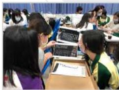
休閒活動規劃與設計 (必修) 設計六合夜市實境解謎遊戲 培養創意策劃與問題解決能力