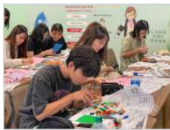
服務設計思考 (選修) 運用樂高及手作材料，把創意 構想實際動手做出來，培養創 新與實作能力