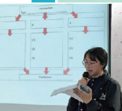
學生雙語導覽解說練習