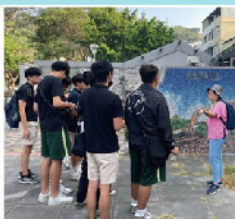
學生雙語校外教學 Free Walking Tour