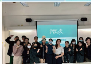
聘請Free Walking Tour 業師 教授雙語導覽解說技巧